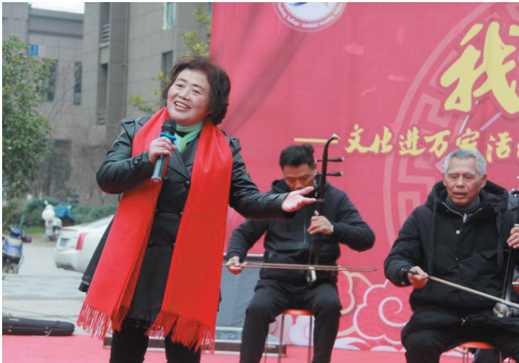
近日,南通开发区小海街道紫琅社区居民自编自导,举办“我们的中国梦”——文化进万家暨“庆元旦、迎新春”惠民文艺演出活动,大力宣传贯彻党的十九届四中全会精神。 黄建平