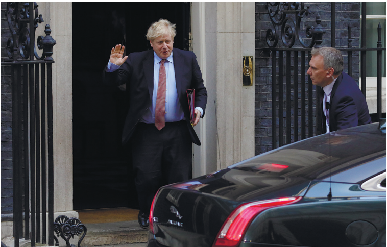
因确诊感染新冠病毒而自我隔离的英国首相鲍里斯·约翰逊四月五日入院接受检测。