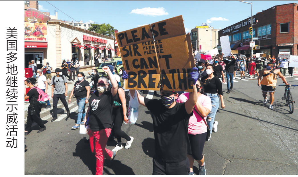
美国多地继续示威活动

时,如果天气晴好,公众会发现月面会有一个从亮到暗,再从暗恢复到亮的过程。”史志成说。 6月12日,两颗行星火星与海王星将在天宇“相合”,上演“星星相吸”好戏。 6月16日,浪漫的六月天琴座流星雨将“绽放”夜空。“该流星雨多产生蓝色或白色的流星,虽然流量不大,但今年极大时的月相已经接近残月,对观测影响不大。”史志成说。 6月21日,作为2020年最为重要的天象,精彩绝伦的日环食将震撼登场。本次日环食最大的特点就是食分(月亮遮住太阳直径的比例)达到了0.994,也就是非常接近全食。这样的日环食也被称之为“金边日食”。 周润健