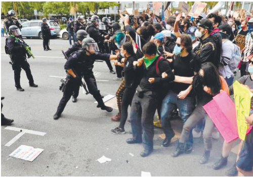
在美国洛杉矶,示威者与警方发生冲突。