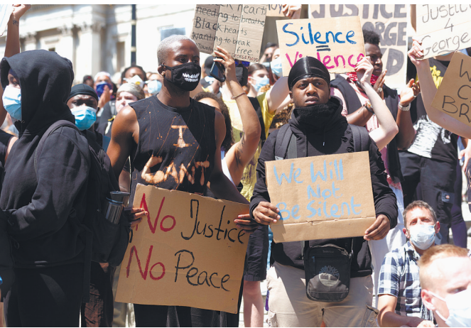
5月31日,人们手持标语在英国伦敦参加抗议活动。

苹果公司宣布,由于担心抗议活动危及员工安全,5月31日将继续关闭一批门店。苹果公司位于美国的271家门店先前因新冠疫情关闭将近一半,上周重开了大约100家。 据新华社