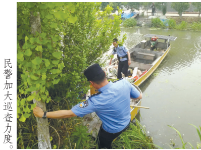
民警加大巡查力度。