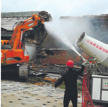
雾炮车在拆迁工地现场。