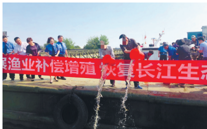
增殖放流现场。

当天上午，田某甲、田某乙非法捕捞水产品案在如皋第一中专公开开庭审理，当庭判处田某甲拘役三个月，田某乙拘役三个