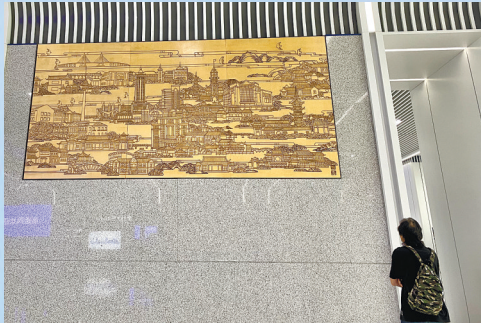
公共艺术壁画《濠河慢咏》。

晚报讯 时隔一周,再次来到南通西站,这里也有了新变化:站在大厅内,举目四望,站房内窗明几净,显得十分通透,各种设施也陆续到位。昨天上午,记者在现场看到,由中铁建工集团承建的通沪铁路南通西站完成开荒保洁工作,站房工程将于今日全面完工,通沪铁路开通运营进入“倒计时”,南通人民将首次在家门口坐上高铁,多年梦想即将实现。