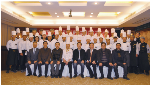
现代学徒制校企合影