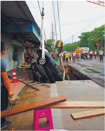
吊起陷入坑里的汽车。

晚报讯 29日凌晨,海安市雅周镇境内的江曲公路一处路段,突发道路塌陷事故,停放于路边的3辆汽车坠落大坑之中,幸无人员伤亡。记者在事故现场看到,施工队正在全力抢修。