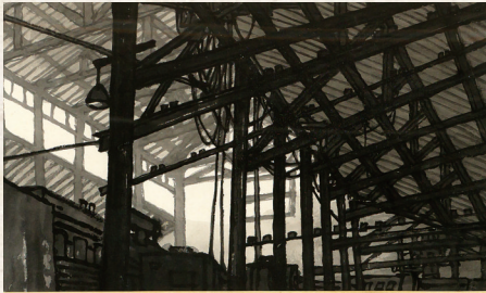
追憶 百 年 港 闸 沈 昌 啓