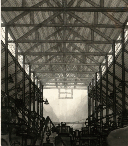
国画《百年追忆》 沈昌启