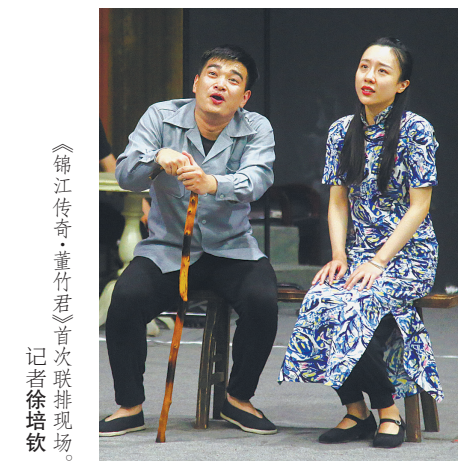
《锦江传奇·董竹君》首次联排现场。