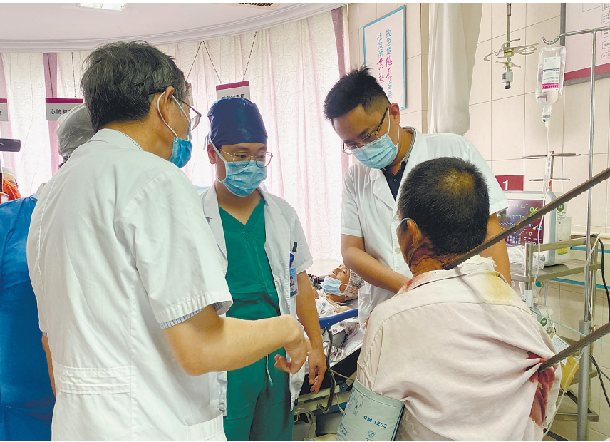
通大附院医生为伤者会诊。