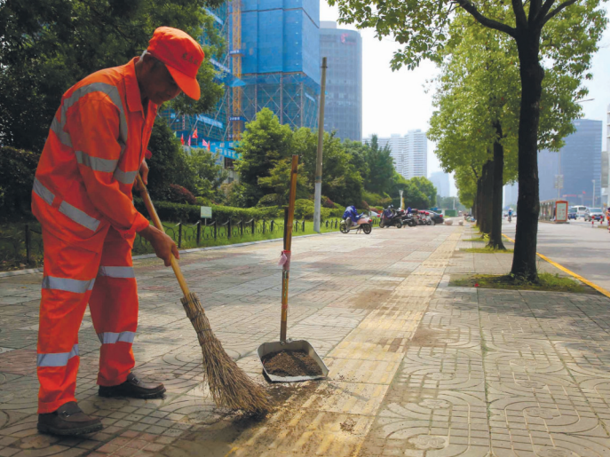
烈日下,环卫师傅清扫街道。记者 尤炼

市城管环卫部门作为环卫工人的贴心“娘家人”,十分关心环卫工人的身心健康。今年,崇川区环卫处为环卫职工配发了含有