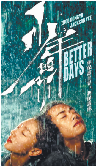
图为电影《少年的你》海报。

除了《少年的你》之外,同获本届奥斯卡最佳国际影片提名的还有《科莱采夫/集体》《酒精计划》《贩皮之人》《艾达怎么了》。据了解,第93届奥斯卡颁奖典礼将推迟至4月25日举行。张漫子