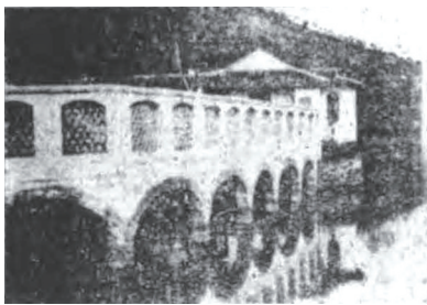
▲后张榭一角(摄于建筑南侧围墙内,原载《新嘉坡画报》第42期)