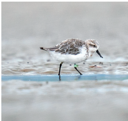
出现在如东的勺嘴鹬“7M”。 胡晓峰