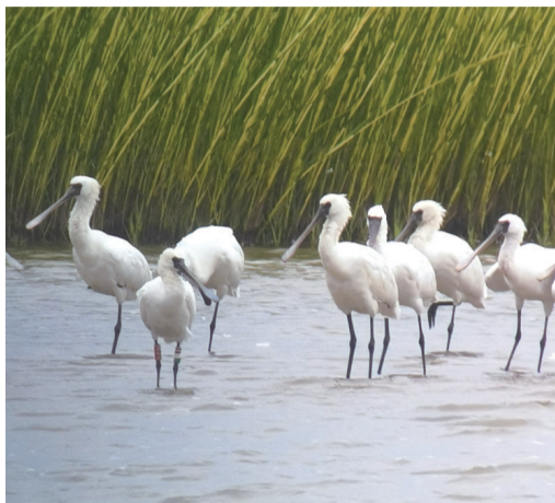
出现在通州湾的黑脸琵鹭。 吴文昊

晚报讯 作为候鸟南迁的重要“驿站”之一,南通迎来候鸟迁徙高峰期。这几天,江苏省南通环境监测中心生态观测人员在如东东凌滩涂记录到22只勺嘴鹬。其中一只带有浅绿色旗标、编号为7M的“小勺子”是连续3年“打卡”如东的老朋友了,本次为全球第3次回记录。