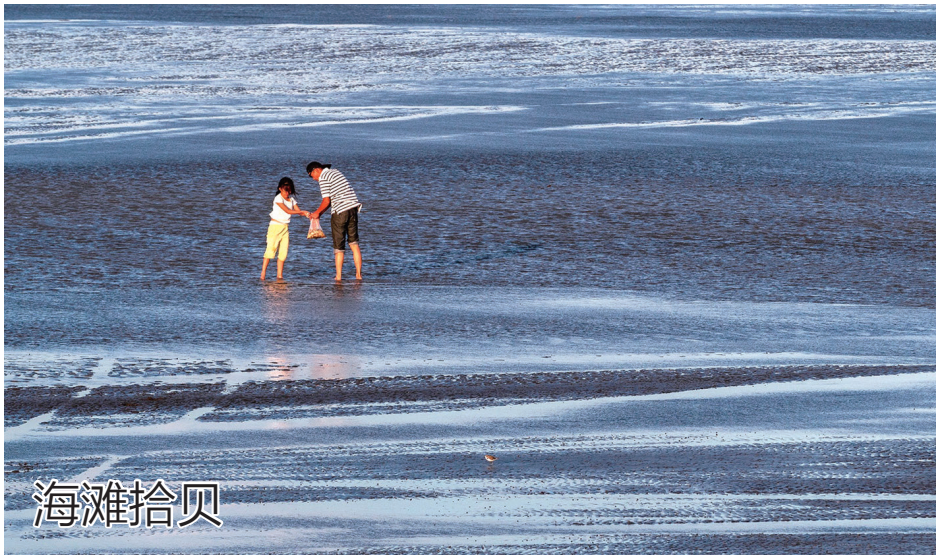
微友老兵摄于启东黄金海滩。