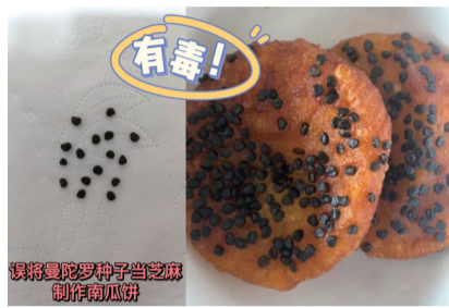
▲含毒南瓜饼。周朝晖 ▼艳丽曼陀罗。沈佳颖