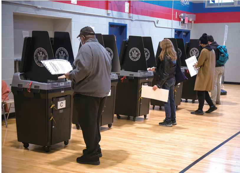
11月8日,选民在美国纽约的一处投票站参加中期选举投票。

观察人士指出,中期选举的重重乱象凸显美国民主制度的崩塌失灵,政客们醉心于党争,无暇、无力、更无心解决选民关注的问题。