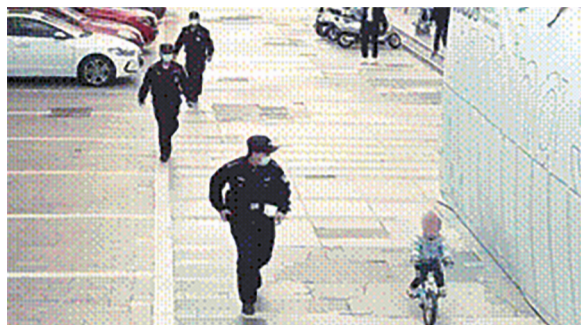
民警护送小男孩,监控拍下的视频截图。

到达现场后,民警发现小男孩在店内正津津有味享用热心店员给的小零食。可见到警察叔叔后,小男孩竟露出了害怕的神情。民警询问他情况,小男孩也不理