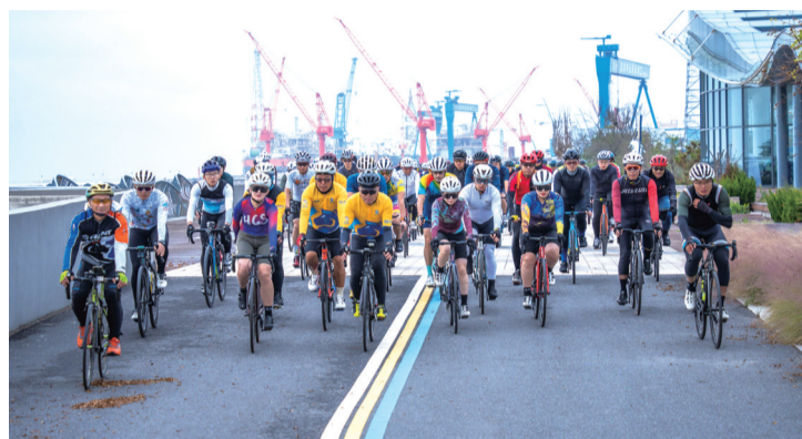
自行车邀请赛现场。兵哥哥

晚报讯 昨天,第12届环启168公里自行车邀请赛在黄海之滨的圆陀角旅游度假区渔人码头景点开赛,来自南通地区的300多名骑行爱好者一起追江逐浪打卡“江风海韵”。