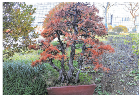
受损的盆景。