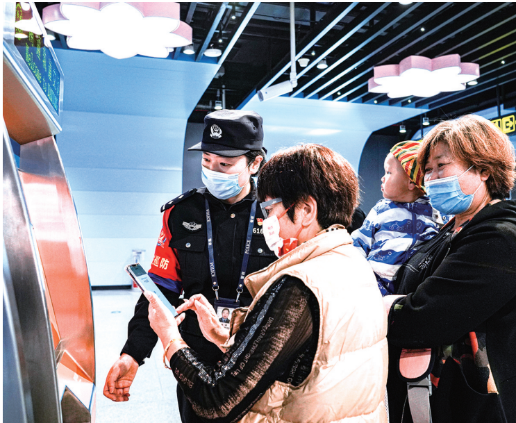
警察帮助服务群众。

昨天,南通地铁1号线开通“满月”。记者从市公安局获悉,一个月来,1号线客运总量123万余人次,南通警方共出动警力3700余人次,全力做好接处警、巡逻防范、矛盾调解、安全监管、服务群众等各项工作,累计帮助服务群众1.8万余人次。一个月中,共有307件违禁物品被查获,包括管制刀具、充气气球、超标充电宝、高度酒精等。