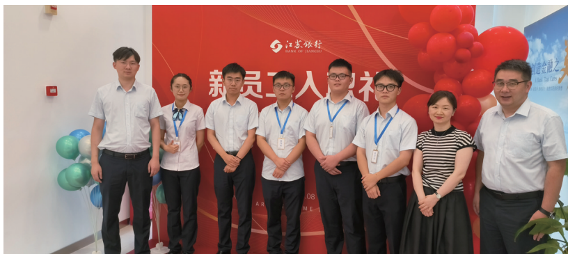
通州湾支行为新入行员工举办温馨热烈的欢迎仪式。

平台将于今年年底前正式上线,届时,广大竞投者将可以直接线上报名竞拍、缴纳保证金及成交款。通过全流程线上交易,真正实现“信息资源公开透明、交易流程简化缩短,疫情防控风险降低”的目标,大大节省交易双方的时间及交通成本,吸引全省乃至全国各地社会资本参与竞投,有效促进示范区农村土地等资源的盘活利用,实现多数产权的溢价上浮,不断壮大村级集体经济、促进农民增收,为推进乡村振兴注入新动能。