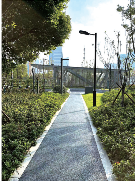
清爽整洁的慢行步道提升市民出行体验。 记者蒋娇娇