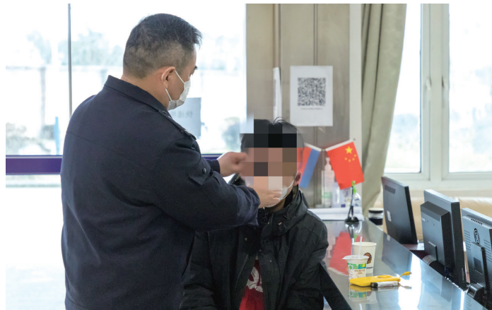
民警安抚少年情绪。宣滨