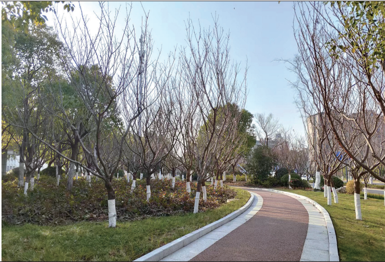
见义勇为小游园。

300米见绿、500米见园,让绿满崇川变为现实,成为美丽崇川、宜居崇川的生动写照。