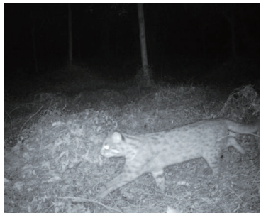
红外相机拍摄到的豹猫。