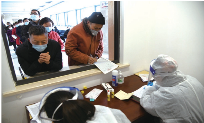
发放司法救助金。通讯员丁玉楠

晚报讯 17至18日,如东法院开展司法救助金集中发放活动,对180案涉200余名生活困难申请执行人发放司法救助金60.6万元,用实际行动传递司法温情,有效缓解被发放对象的燃眉之急。