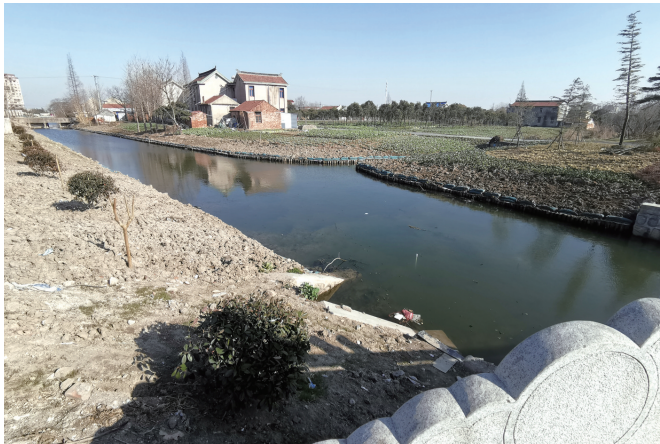
整治过的白家桥河。

去年9月,在省“政风热线·市长上线”节目中,我市市民反映位于崇川区与通州区交界处的白家桥河河道脏乱、水体黑臭。那么,近半年过去,整治情况如何?昨天,本报记者进行了实地探访。