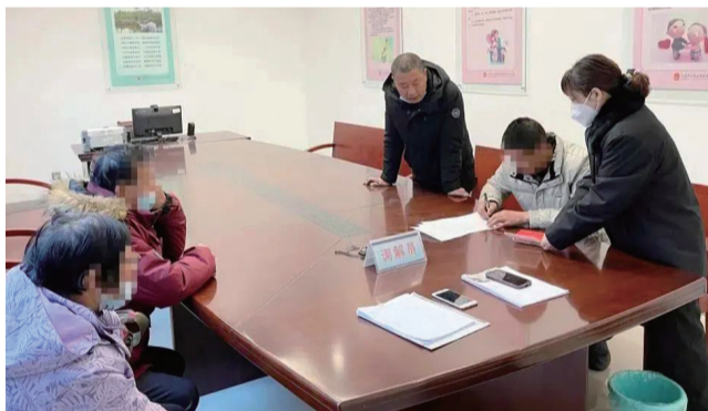
当事人现场达成调解协议。

晚报讯 “感谢宗法官,拖了近一年的工资终于有着落了,过完年我们也能安心出去打工了!”新年伊始,如皋法院开发区法庭成功调解4名农民工追索劳动报酬纠纷,并当场制发法律文书。法庭内,4名当事人激动地向法官道谢。