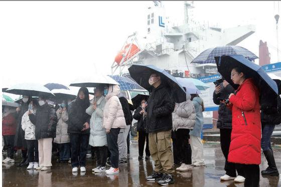
南通籍高校学生代表在中远川崎参观。

最熟是乡音、最浓是乡情、最爱是乡土。昨天,我市举办2023年“学子心·家乡情”百名学子新春座谈会,邀请140多名在外求学的南通籍高校学生、人才补贴享受人员和优秀青年人才代表感受家乡变化,了解人才政策,同时诚邀12万在外的南通籍优秀学子情系桑梓、雁归江海,与家乡南通共创美好未来!