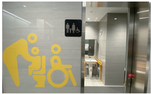
地铁1号线地下第三卫生间。