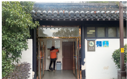
濠河景区第三卫生间。

目前,我市第三卫生间建设管理情况如何?市民对第三卫生间的了解和使用情况又如何?昨天,记者走访市区景区、商场、地铁站等人流量密集的公共场所,一探究竟。