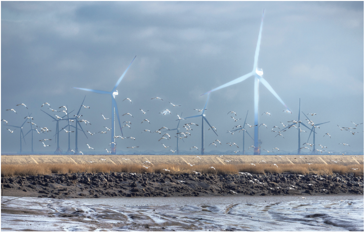
共舞 1月25日,如东刘埭海边,反嘴鹬掠过滩涂。 娄忠银