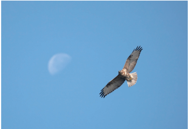
翱翔 1月15日,军山上空,一只普通鵟在月影下展翅翱翔。 管昊昱