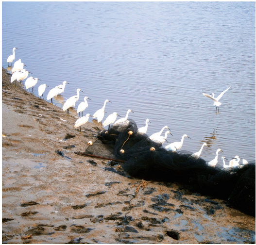
检阅 2月8日,启东黄海滩涂,一队白鹭似排队检阅。 黄是春