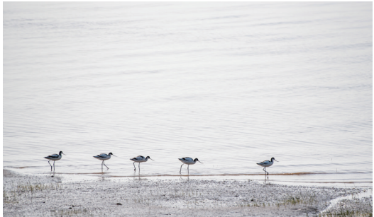
齐步 春天来了,启东头兴港河入江口附近江边,一队反嘴鹬齐步走。 沈宇星