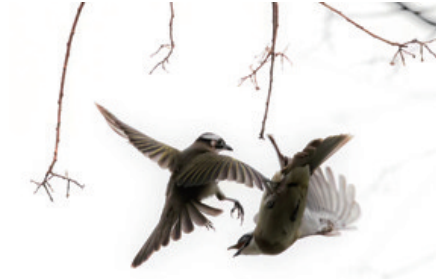
嬉戏 2月18日,濠河之畔,两只白头鹬在树丛中追逐嬉戏。 钱咸华