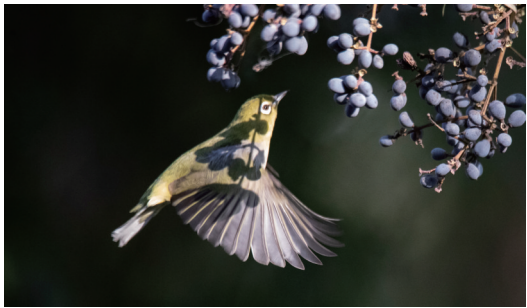
品尝 2月1日,文峰公园内,一只暗绿绣眼鸟品尝女贞果实。 袁建