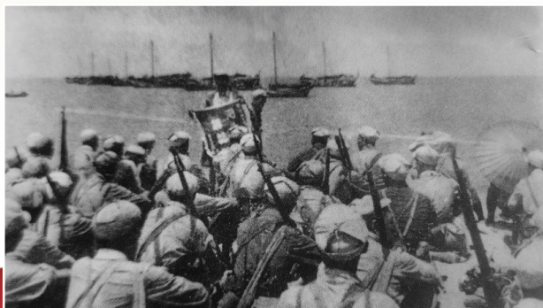
郁文所在的 海作战前进行 红旗教育。

1975年11月7日下午,“郁文同志追悼大会”在北京八宝山革命公墓礼堂举行,追悼会由郁文的老领导时任中央军委委员、国务院国防工业办公室主任洪学智上将主持,郁文的好战友时任中国人民解放军空军组织部部长、第三机械工业部第六研究院政治委员夏屏西致悼词。悼词对郁文同志的一生作出了高度的评价。郁文把自己的一生毫不保留地贡献给了绚丽的共产主义事业,将军对家人的严与爱和对组织的信任与服从,有两个小故事可见一斑。一是1958年,郁文胞弟襄瑞先生致信兄长,希望能