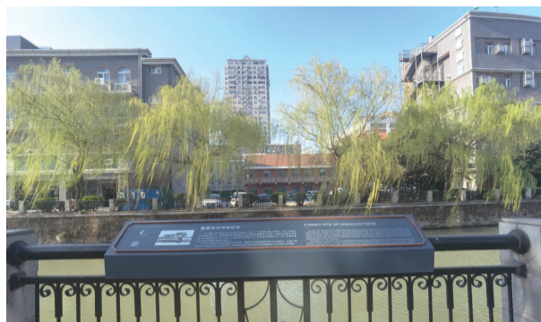
解读标牌。镶嵌在栏杆上的文化遗产

据悉,濠南历史街区文化遗产解读一期工程,选取了濠南路、桃坞路沿线城南别业、翰墨林印书局、濠阳小筑、女工传习所、通明电气公司、有斐馆、更俗剧场、江苏银行、桃之华馆、通州师范学校10处历史遗