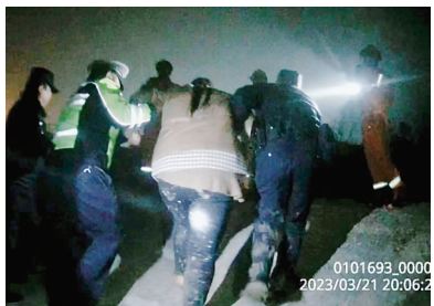
救人现场。

打开空调取暖,并联系了她的家人。经询问得知,女子因生活琐事与家人发生口角,一时想不开跑至海边滩涂欲轻生。经民警现场开导,女子在家人的陪伴下踏上回家的路。