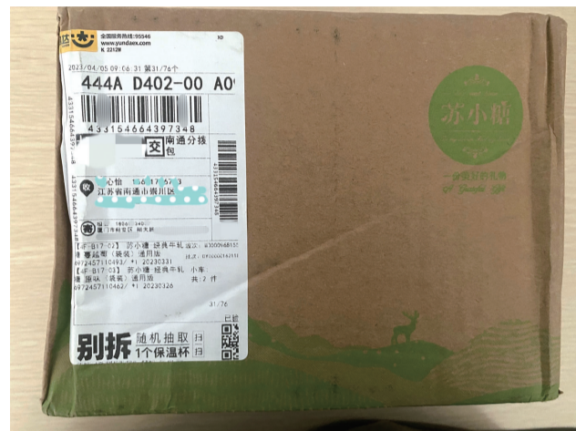
一名市民快递上的电子面单。

此外，在叶女士看来，“新国标”进一步规范了快递企业保护个人隐私的行为，“如果快递都能使用隐私面单，那无疑对保护个人信息是一件好事，以后扔快递就没有什么顾虑了，希望越来越多的快递都能采取这种做法。”