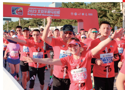
4月16日，参赛选手们从起点出发。当日，2023年北京半程马拉松赛举行。