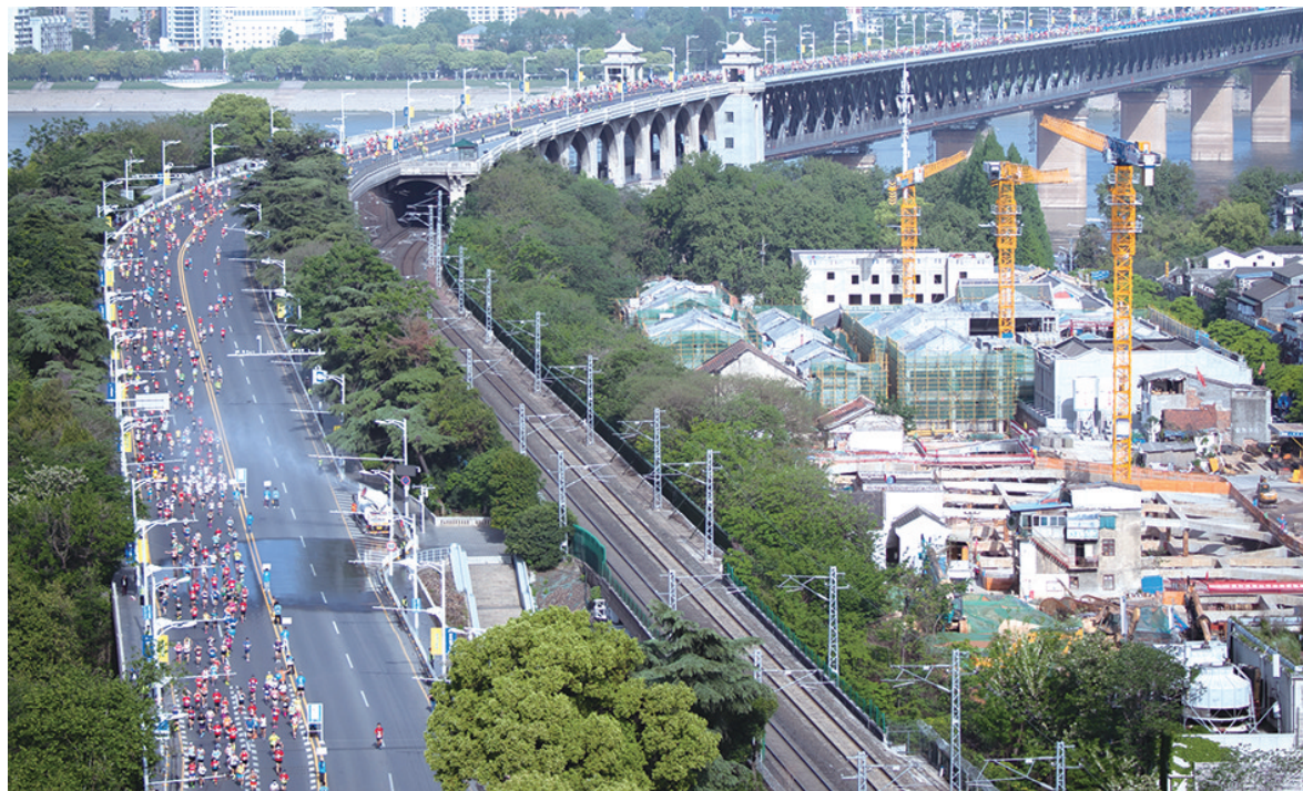
四月十六日，二〇二三武汉马拉松比赛鸣枪开跑，参赛选手经过长江大桥。

春深似海，随着气温迅速升高的还有人们的跑马热情。据不完全统计，仅4月15日、16日这个周末，全国各地就有30多场路跑赛事进行，武汉、北京、上海等地的赛事在社交平台成为热门话题。新华社记者观察，今春马拉松呈现全面回归态势，新兴赛事遍地开花且特色突出，从部分比赛暴增的报名人数来看，跑马热度甚至超过三年前。各地以跑步为媒，把全民健身热情与城市发展活力相融合，搭建起与马拉松配套的体育消费节、旅游节、博览会等平台，展示当地特色的人文景观、优美的生态环境以及细致的公共服务。