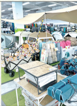
我市一户外用品店露营展区。

入春以来,亲近自然、小出行半径、强调美学价值的露营经济在南通掀起一阵潮流。从“围炉煮茶”到“露营周边”,上中下游的消费场景不断更新。小红书上近5000篇的本地笔记昭示着露营在南通正从小众走向大众,露营经济像一块正被做大的蛋糕,由通城市民共创共享。