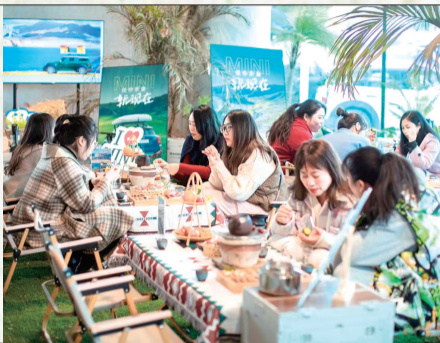
顾客在露营餐厅团建聚餐。