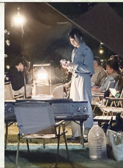
市民在紫琅湖边夜间露营。