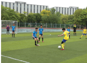
比赛场景。

全国青少年校园足球试点县(市、区),3个江苏省青少年校园足球试点县(市、区),3个全国青少年校园足球“满天星”训练营基地,192所全国青少年校园足球特色学校,6所江苏省足球后备人才示范学校,20所全国足球特色幼儿园示范园,50所全国校园足球特色幼儿园。