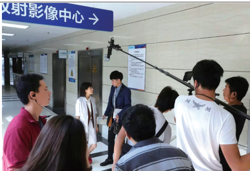
市六院成多部热门剧的拍摄地。

令人赏心悦目的康复花园、下沉庭院,充满人文关怀的母婴室和第三卫生间,洋溢着欢声笑语的儿童乐园、托育园……今年,我市以推进文明城市创建为契机,全面启动“美丽医院”建设,围绕“环境美、服务美、人文美”发力,擦亮健康南通底色。连日来,记者实地探访我市一批美丽医院的耀眼蝶变。