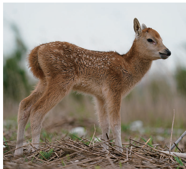
刚出生不久的小麋鹿。信誉

麋鹿是我国自然分布的物种,是国家一级保护野生动物,曾一度在野外消失,经过多年不懈努力,人工繁育种群不断壮大,并重建了野外种群,成为全球野生动物保护领域野外种群恢复的成功典范。近年来,随着江苏沿海地区生态环境保