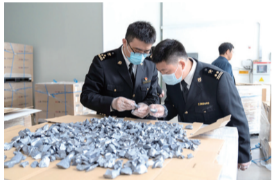
查获的洋垃圾。

经中国环境科学研究院固体废物污染控制技术研究所鉴定,上述货物中部分规格型号、申报重量7.2吨的货物为多晶硅废碎料,为我国禁止进口的洋垃圾。南通海关依法督促涉案