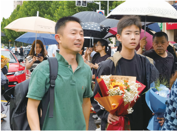
家长将鲜花和祝福送给考生。

晚报讯 昨天上午11点整,随着一声铃响,2023年南通初中毕业升学考试全部结束。我市数万考生完成了自己人生的一次大考,将走上新的人生阶段。