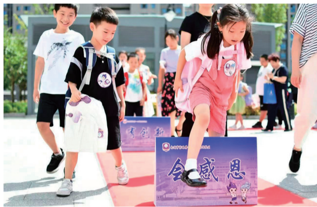
新生跨过“三有三会”品格栏。