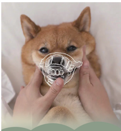
人员密集场合 给它戴上嘴套

新修订的《中华人民共和国动物防疫法》规定,携带犬只出户的,应当按照规定佩戴犬牌并采取系犬绳等措施,防止犬只伤人、疫病传播。系好犬绳,既是对他人的尊重,也是对狗狗安全的保护。