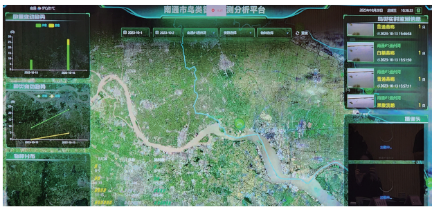
观测演示。 记者彭军君

晚报讯 昨天,记者从南通市生态环境局召开的新闻发布会上获悉,南通针对勺嘴鹬、黑脸琵鹭、小天鹅等珍稀濒危鸟类,在全国率先探索运用AI(人工智能)技术实现全天候监测与保护。