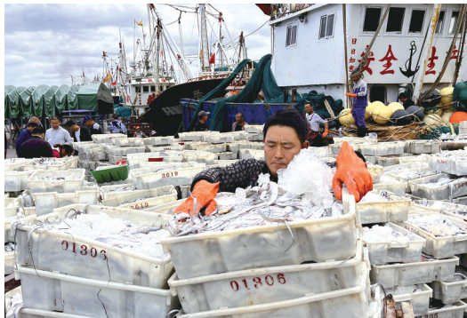
▲渔获 十月六日,启东吕四港,刚刚卸船的海产品堆满了码头,装卸工搬运装车。 王亚东