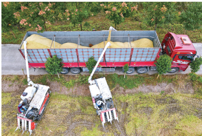
►丰产 十一日,如皋市如城街道沿河村“万顷良田项目区”,收割机卸下刚刚收割的稻谷。 吴树建