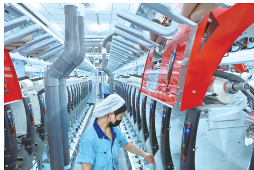
▲智纺 7日,江苏大生智慧纺纱工厂生产车间内景。这家工厂是“十四五”全国第一个“智慧纺纱工厂”,也是全国纺织行业首个运用5G数据传输技术和智能管理云平台的工厂。 许丛军