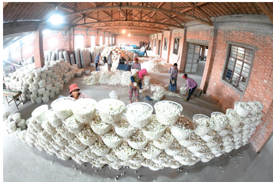
◀收购 连日来,海安高新区隆政街道新丰村蚕茧收购点,前来交售蚕茧的蚕农络绎不绝,现场一片忙碌。 顾华夏