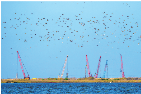
▲崛起 16日,通州湾,远眺一新电厂建设工地。 袁建