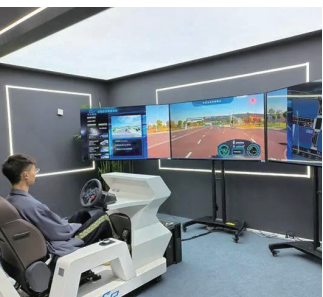
一位观众正在展区体验智能驾驶相关设备产品。