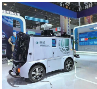
物博会上的国家电网展区推出的无人巡检车。

行自动装配，智能搬运设备来回奔波运送物料，生产状况等信息实时显示在调度大屏……记者在展览现场，看到了不少企业车间的“数字化转型”模拟场景。 新华社记者何磊静