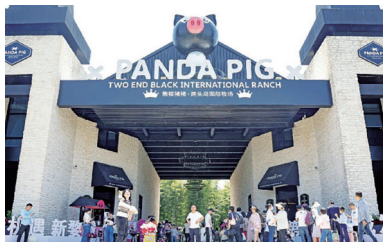
熊猫猪猪·两头乌国际牧场