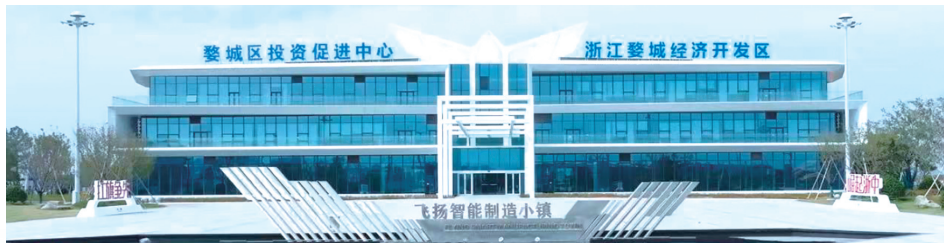
飞扬智能制造小镇