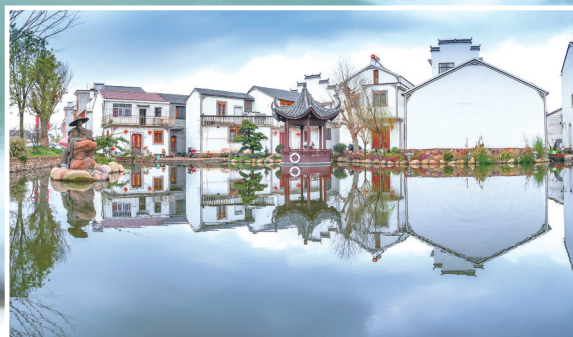
金东琐园国际研学村