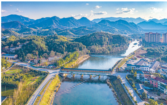
婺城区白沙溪三十六堰