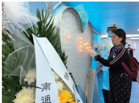
海葬活动上,家属寄托哀思。 记者范译